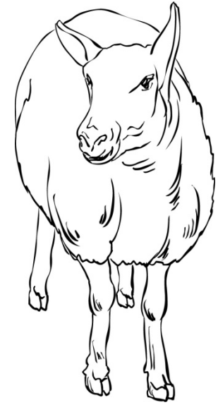
moeder het schaap